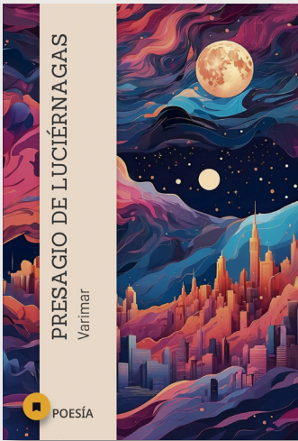
Presagio de luciérnagas Varimar